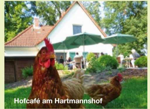
Hofcafé am Hartmannshof

Kinder freuen sich über Erlebnis- und Spiel-einrichtungen – etwa einen Spielnistkasten in zehnfacher Vergrößerung. Wer hineinklettert, wird erfahren, wie sich Familie Grauschnapper fühlt. Beobachten Sie Wellen in den Klangschaalen, bauen Sie Steinmännchen, lauschen Sie den Obertönen der Windharfe und bringen Sie Wasser zum Tanzen. Schilder informieren näher über einzelne Themen. Es gibt auch Texte in Leichter Sprache.